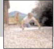
Tip AL: Kaba malzemenin çıkartılması.